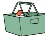
必要な分だけを買う