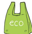
エコバッグを使う

6月は、環境月間です。地球や自然を守るために、身近なことから実践することが大切です。ここで紹介されていること以外にも、どんなことができるのかを考えてみましょう。