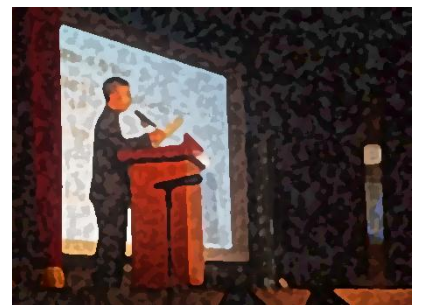
連合英語スピーチ