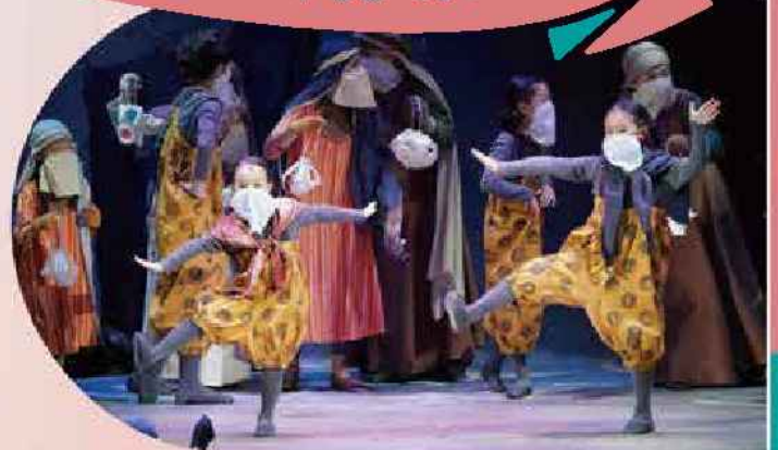
2020年公演写真(立川市)